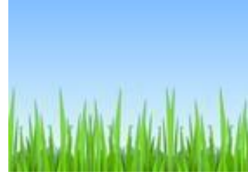
Những loại thực vật như cỏ sẽ tạo ra phấn hoa

Những tác nhân gây dị ứng từ môi trường bao gồm lớp sừng (vảy da) và nước bọt của động vật, hạt bụi, phấn hoa và nấm mốc. Trẻ bị eczema cũng có thể bị dị ứng với môi trường. Đối với những trẻ này, việc tiếp xúc với tác nhân gây dị ứng có thể khiến bệnh eczema chuyển biến xấu đi. Nếu trẻ dị ứng với một số tác nhân gây dị ứng cụ thể trong môi trường, hãy hạn chế để trẻ tiếp xúc với những tác nhân đó nếu có thể.