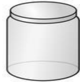
Chất dưỡng ẩm kết cấu đặc thường được đựng trong hũ

Chất dưỡng ẩm có thể chia thành ba nhóm dựa trên lượng dầu hoặc mỡ so với lượng nước trong thành phần. Ba nhóm này là thuốc mỡ, kem dưỡng và dung dịch dưỡng (lotion). Thuốc mỡ chỉ bao gồm mỡ và không chứa nhiều nước. Loại này thường rất đặc, trong và gần như không màu. Kem dưỡng thường là hỗn hợp nửa dầu (hoặc mỡ) nửa nước. Loại này thường hơi đặc nên khó đổ ra, đựng trong hũ và thường có màu trắng. Dung dịch dưỡng là kem dưỡng được bổ sung nhiều nước hơn. Loại này dễ đổ ra hoặc có vòi bơm và thường có màu trắng.