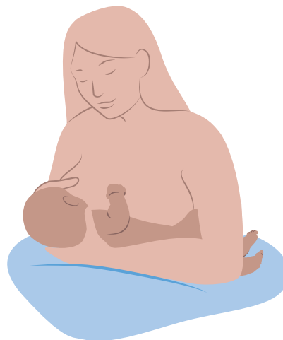
Position de la madone (ou du « berceau »)