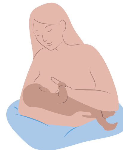
Position de la madone inversée (ou du « berceau inversé »)