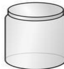
Les hydratants épais viennent dans des bocaux

Les hydratants peuvent être divisés en trois catégories en fonction de la quantité d'huile ou de graisse par rapport à la quantité d'eau présente. Ces trois groupes sont appelés : pommades, crèmes et lotions. Les onguents ne sont que de la graisse et ne contiennent pas beaucoup d'eau. Ils sont généralement très épais, clairs et presque incolores. Les crèmes sont généralement un mélange moitié-moitié d'huile (ou de graisse) et d'eau. Ils sont généralement trop épais pour les verser, et se présentent dans des bocaux et souvent de couleur blanche. Les lotions sont des crèmes avec beaucoup plus d'eau ajoutée. Ils sont versables ou présentés avec un distributeur à pompe et ils sont normalement de couleur blanche.