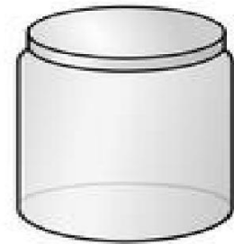
用瓶子盛載的 濃稠潤膚用品

潤膚用品可根據油份和水份的比例分成三類。這三類用品是潤膚膏、潤膚霜和潤膚水。潤膚膏只含油份，並沒有水份，它們一般十分濃稠、晶亮和接近透明。潤膚霜含水份和油份各半，它們也十分濃稠，難以倒出來，用瓶子盛載，一般呈白色。潤膚水是含有較多水份的潤膚霜，一般是白色，可以倒出來使用，或附有供液泵。