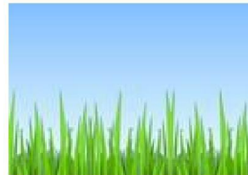
像青草的植物會製造花粉

環境方面的過敏原包括動物皮屑及唾液、塵蟎、花粉及霉菌。患有濕疹的孩子可能亦對環境過敏。對於這類兒童，接觸這類過敏原也會使濕疹惡化。如果你的孩子對某種環境方面的過敏原出現過敏反應，請盡可能讓孩子減少接觸它們。