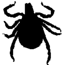
Garrapata hembra adulta Aproximadamente 10 veces su tamaño real